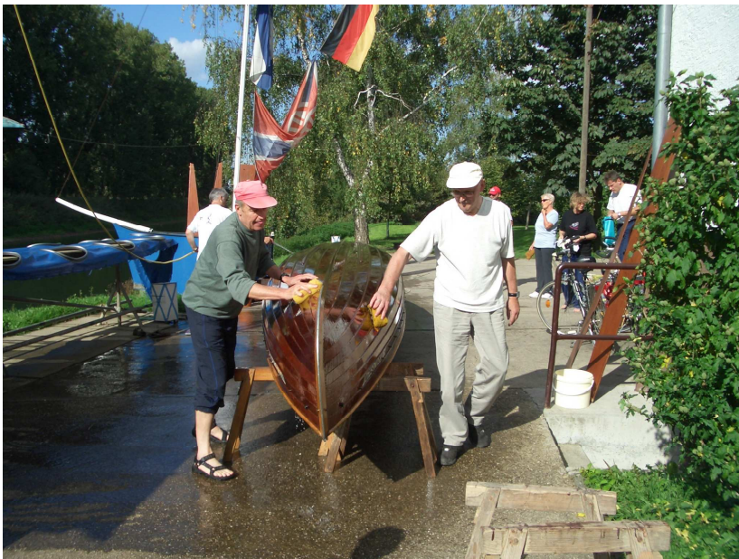
Des Boot muss sauber in die Hall !! ( Man beachte Schockes Elan, alles muss wie geleckt sein.)