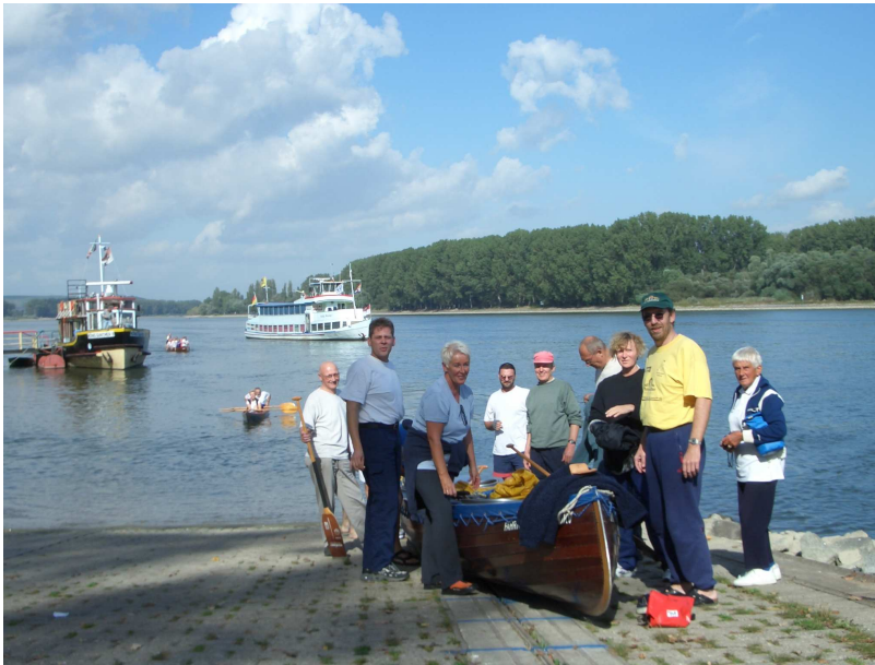
Nach dem Mittagessen, leicht abgeschlafft